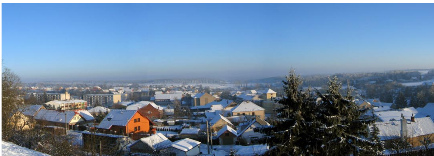
Pohled na Všeřuby od kostela sv. Martina - 30.12. 2010

(Redakce neodpovídá za obsahovou a jazykovou náplň příspěvků čtenářů)