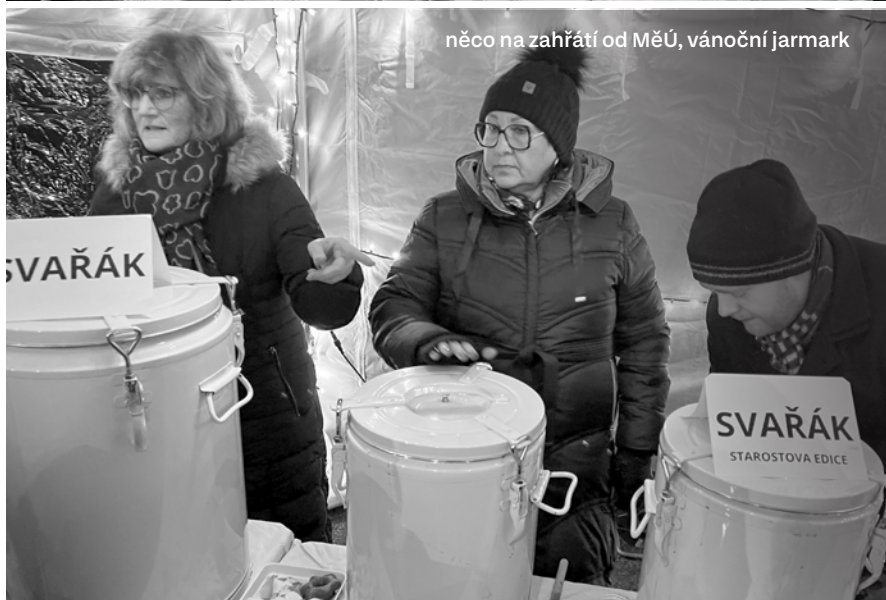
něco na zahřátí od MěÚ, vánoční jarmark