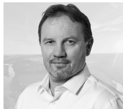
» Václav Červenka, starosta města

Přeji vám krásný a pohodový čas vánoční, mějte se rádi, užívejte si klid a pohodu a buďte co nejvíce spolu, se svými nejbližšími a svými přáteli. Usmívejte se a buďte šťastní a v pohodě.