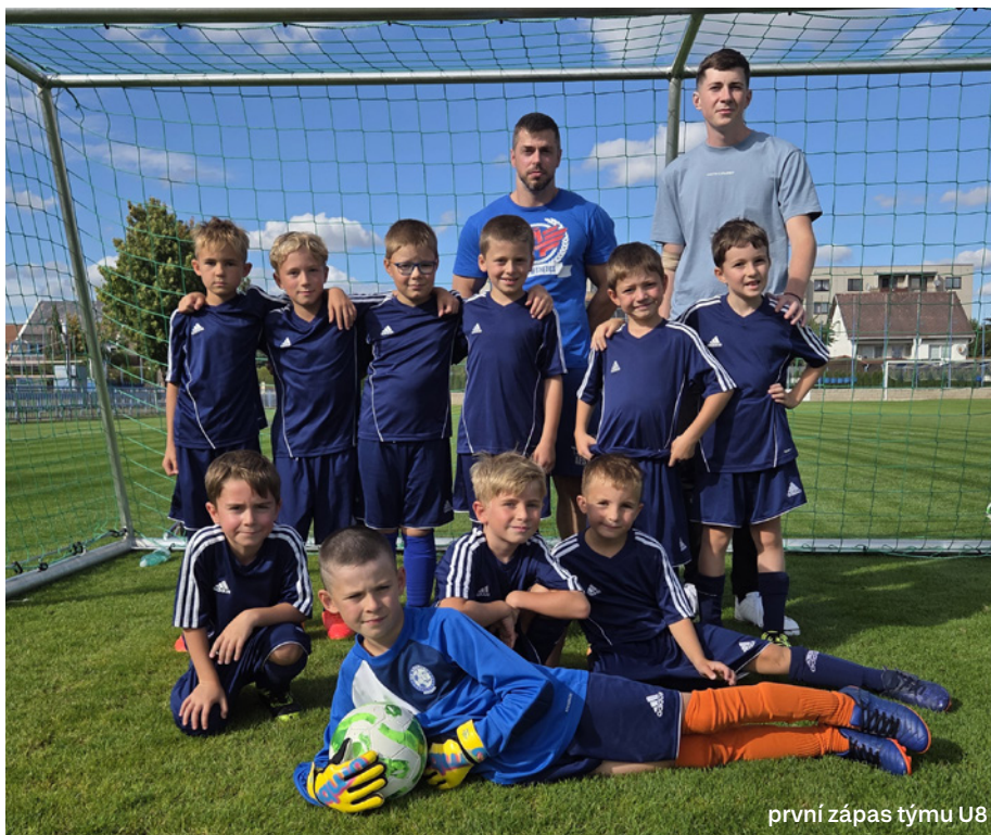
první zápas týmu U8