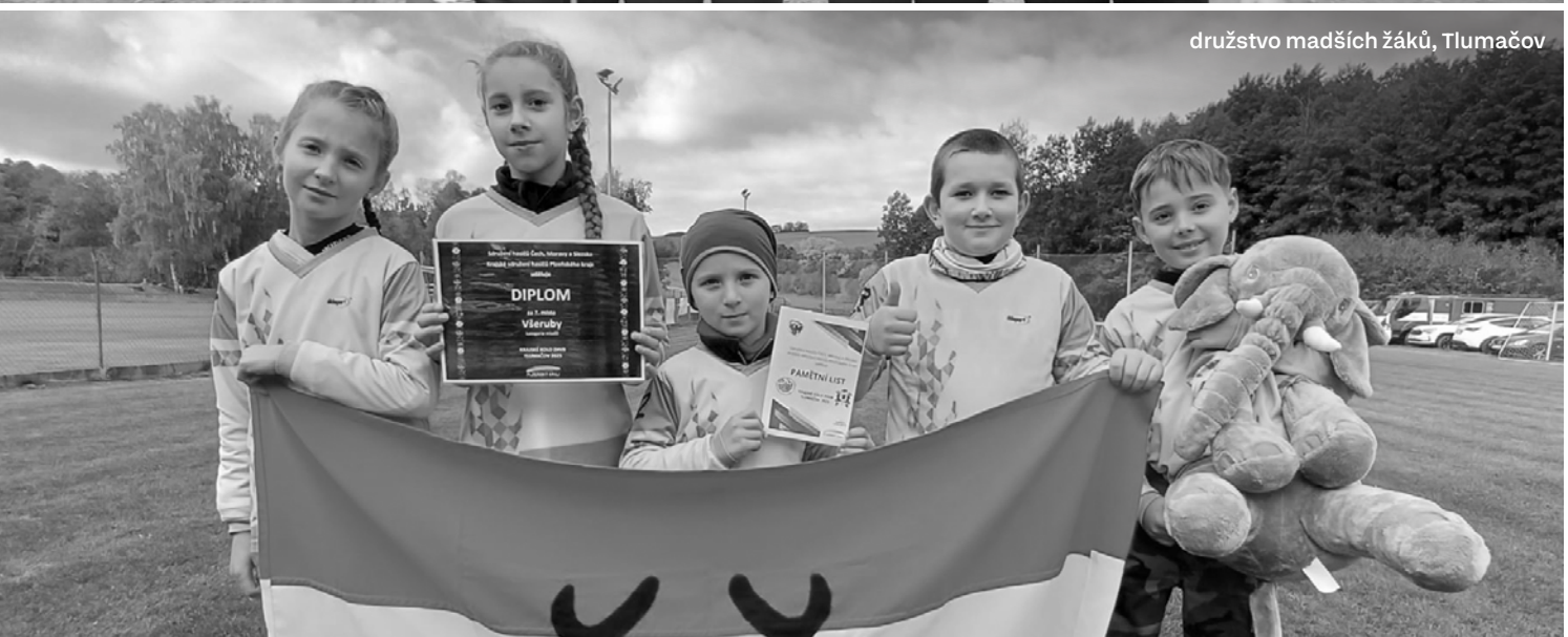
družstvo mladších žáků, Tlumačov