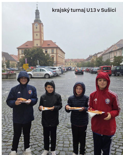
krajský turnaj U13 v Sušici

Podzimní část sezóny je u konce a jak jinak ji zhodnotit než slovy: výsledková mizérie v podání A-týmu, který získal jen pět bodů. Béčko se usadilo v prostředku tabulky, kategorie U11 taktéž. Mladší ročníky si pobyt na trávě po dlouhé letní pauze užívaly jaksepatří.