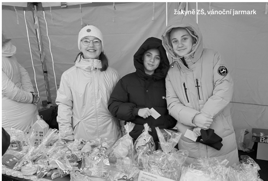
žákyně ZŠ, vánoční jarmark

A o tom přesně bude i soutěž Vesnice roku, kam plánuji v roce 2026 naše město přihlásit. Nyní dávám dohromady partu lidí, o kterých vím, že to vidí stejně jako já a kterým věřím, že to tak skutečně myslí.